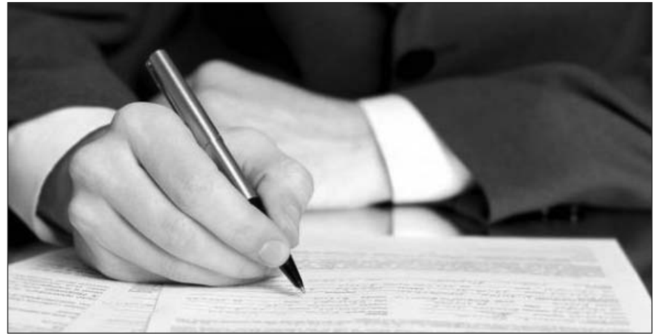
Candidaţii braşoveni şi-au făcut publice averile