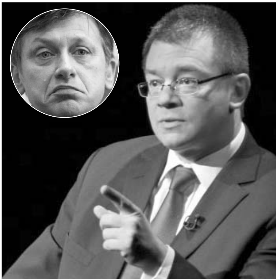
MRU către Antonescu: „Sper că are demnitatea de a veni cu o explicație clară în fața țării”

„Îl auzim încontinuu pe domnul președinte al Senatului, domnul Antonescu, pronunțându-se asupra modului în care instituțiile statului ar fi implicate în politică. Și face referință precisă la serviciile speciale ale României. (...) N-ar fi nicio problemă dacă dom-