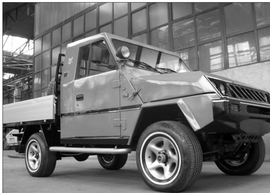
Unul dintre ultimele prototipuri care a ieșit anul trecut pe poarta institutului