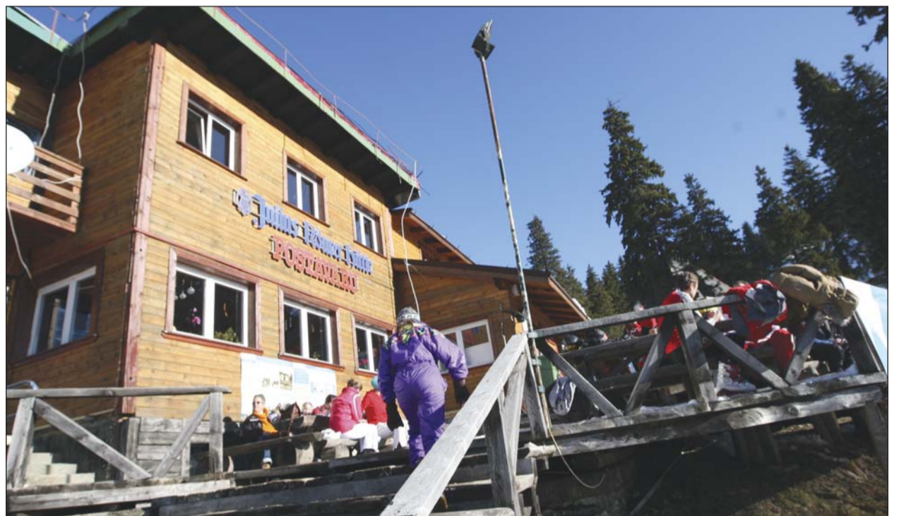
De-a lungul anilor cabana a găzduit sute de mii de turiști oferind experiențe de neuitat

Că locul este încărcat de istorie stau mărturie și grinzile, pe care meșterii au scrijelit sau au scris cu creion chimic diferite mesaje. Cabanierii le povestesc cu multă dragoste turiștilor semnificațiile acelor înscrisuri și îi provoacă la o călătorie în timp. „Inițial, pentru a obține avizele de funcționare, autoritățile ne-au recomandat să îmbrăcăm cu rigips pereții de scândură ai cabanei, dar așa ceva nu era posibil și am refuzat, fiindcă am fi îngropat istoria.