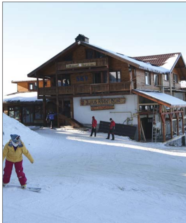
Nu există schior care să nu fi trecut prin Postăvarul