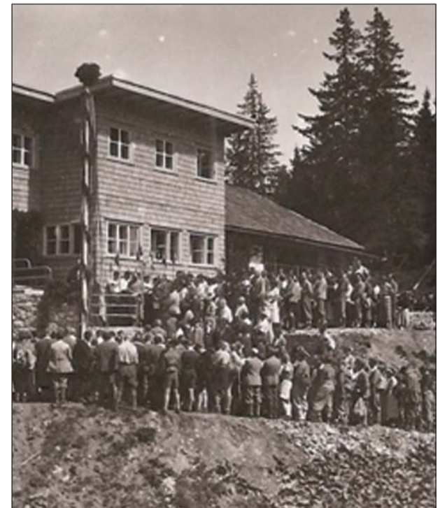
În 1935 cabana primea numele „Julius Römer-Hütte“

Totuși, a mai existat o soluție, iar acum periodic, tratăm lemnul cu o substanță ignifugă, iar inscripțiile au rămas la vedere“, ne-a explicat cabaniera.