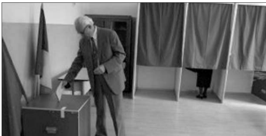
La alegerile din 2012, prezența la vot a brașovenilor a fost mai bună decât cea din 2008

De dimineață însă, prezența în municipiul Brașov a fost destul de slabă, 2,96%, însă, brașovenii au recuperat pe parcursul zilei înregistrându-se în final o prezență de 41,25%. În mediul urban, printre localitățile cu cea mai bună