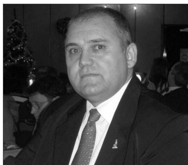
„Când Forța Civică a fost preluată de Ungureanu am decis să mă înscriu în noul partid”