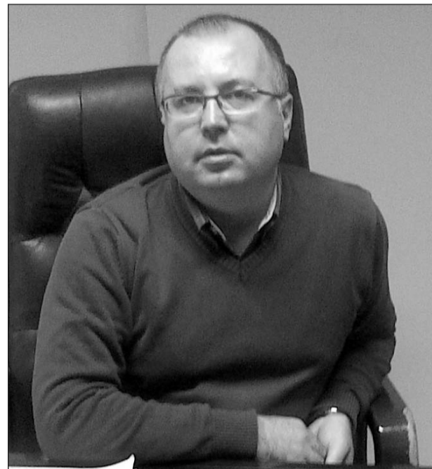
În politică, ca și în restul societății, lucrurile nu evoluează atât de repede pe cât ne-am așteptat

Nu și-a schimbat însă cu nimic convingerile, dar atunci când a apărut Forța Civică s-a aliat noului partid. A simțit că se potrivește mai bine aici. Calitatea umană și profesională a noilor săi colegi, felul profesionist în care sunt tratate problemele, dar mai ales idealismul lor l-au câștigat imediat. A trecut chiar și peste muștrărea soției careia îi promisese că „se lasă” de politică. Are deja o experiență,