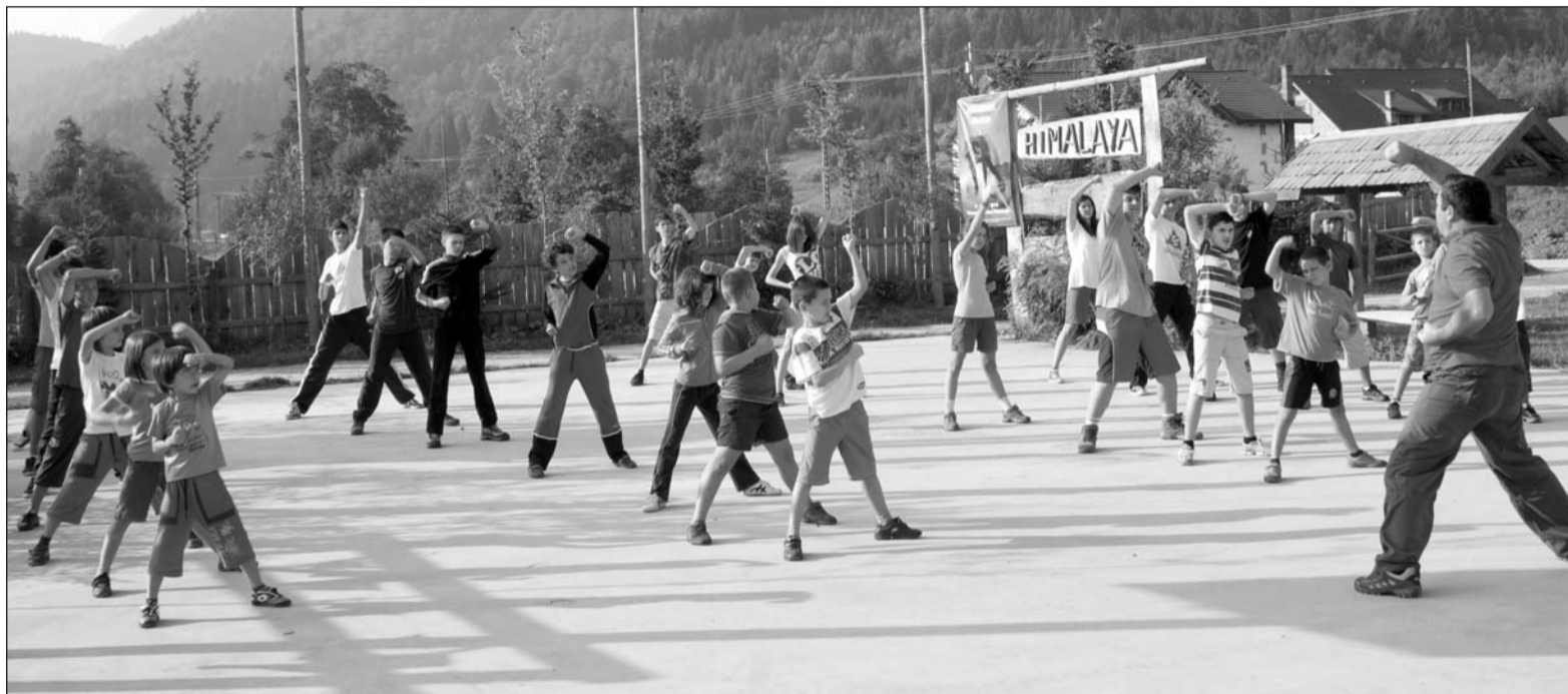
Micuții pot profita că vacanța de vară s-a prelungit pentru a putea petrece încă o săptămână în tabăra de la Râșnov

Fiecare tabără începe și se încheie cu ridicarea/coborârea drapelului și intonarea imnului național, ceea ce ne duce cu gândul la taberele pe care le-am văzut doar în peliculele hollywoodiene. Disciplina este cuvântul de ordine în aceste tabere, drept urmare fiecare zi va avea un program foarte strict.