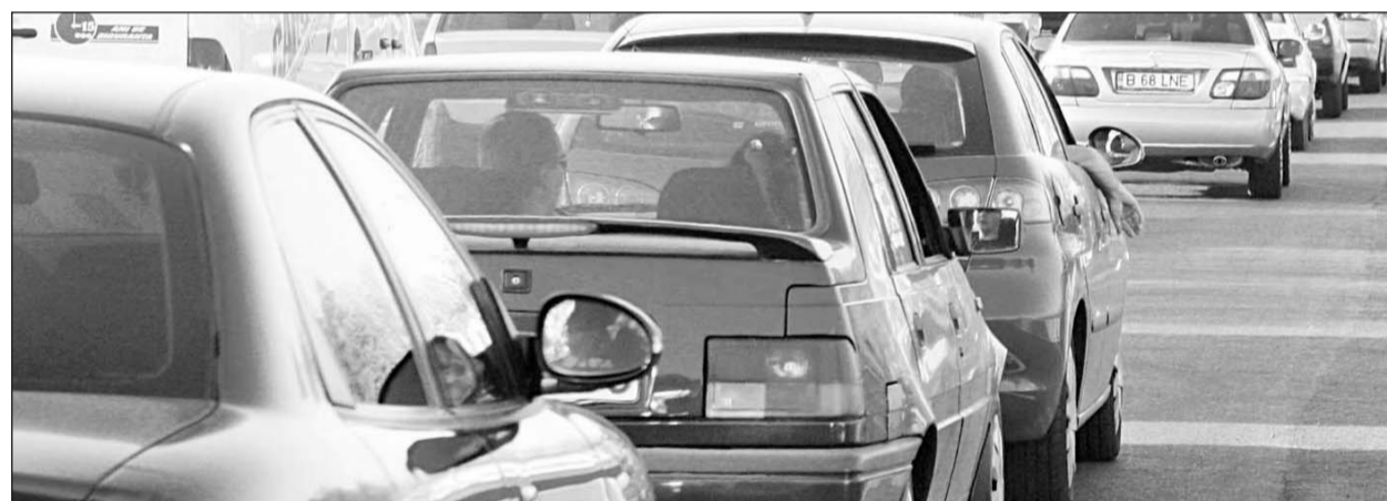
Lipsa unei autostrăzi și a unui aeroport la Brașov aduce pierderi economice uriașe județului nostru

Codlea și Săcele), trei orașe (Ghimbav, Predeal și Râșnov) și zece comune (Bod, Cristian, Feldioara, Hălchiu, Hărman, Prejmer, Sânpetru, Târlungeni, Crizbav și Vulcan). În prezent, dintre cele 16 localități din arealul metropolitan, numai două, respectiv Brașov și Săcele, dispun de un sistem propriu de transport în comun, în timp ce transportul de persoane între localitățile Zonei Metropolitane și Brașov este asigurat de către operatori privați în baza unor licențe de transport acordate de ARR (Autoritatea Rutieră Română).