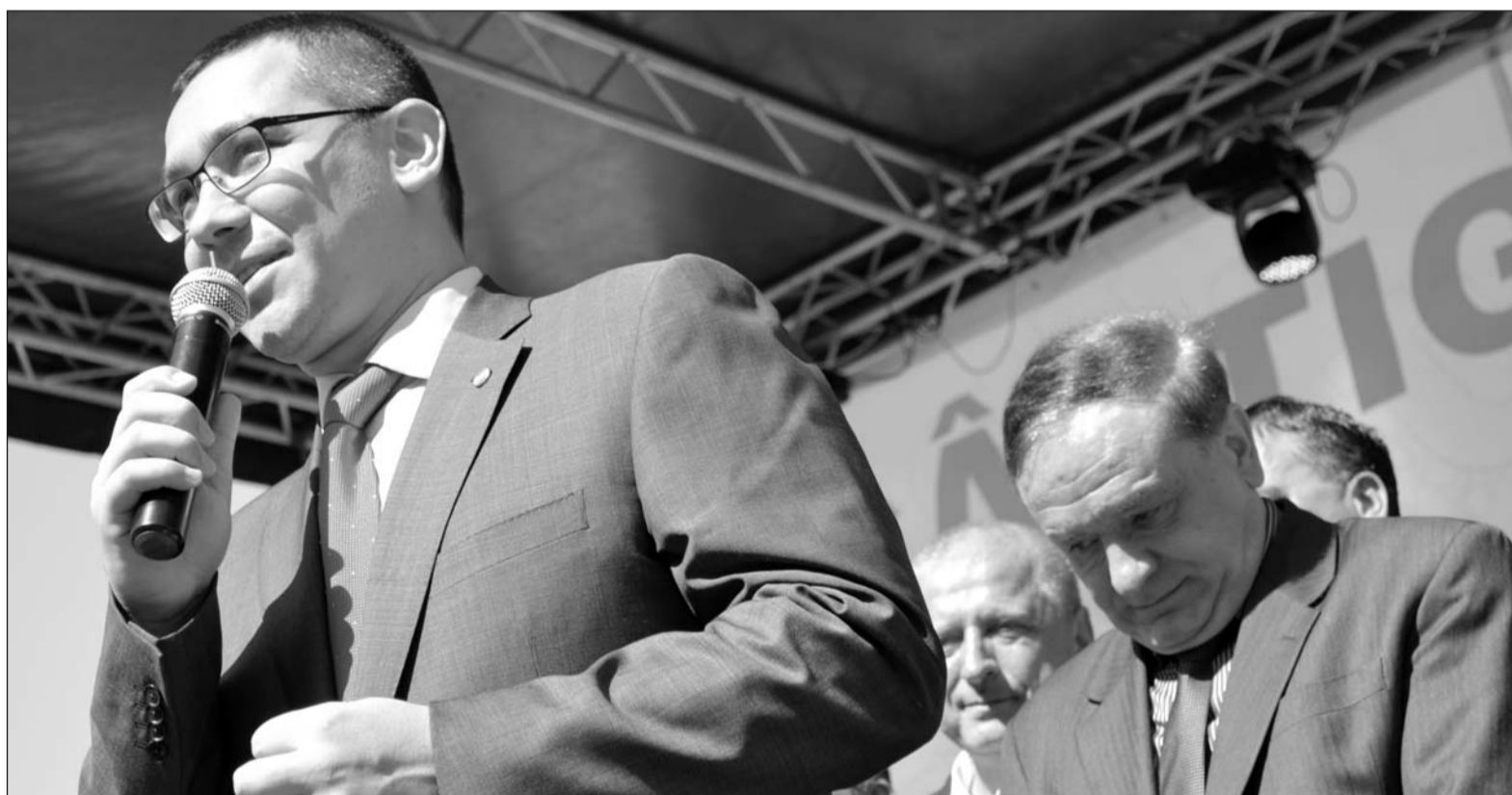
Partenerii de alianţă de la nivel local lasă capul jos şi nu comentează deciziile luate de guvernul USL

În luna mai a acestui an, terenul de pe str. Agricultorilor, în suprafaţă de 10.900 de metri pătraţi a fost trecut