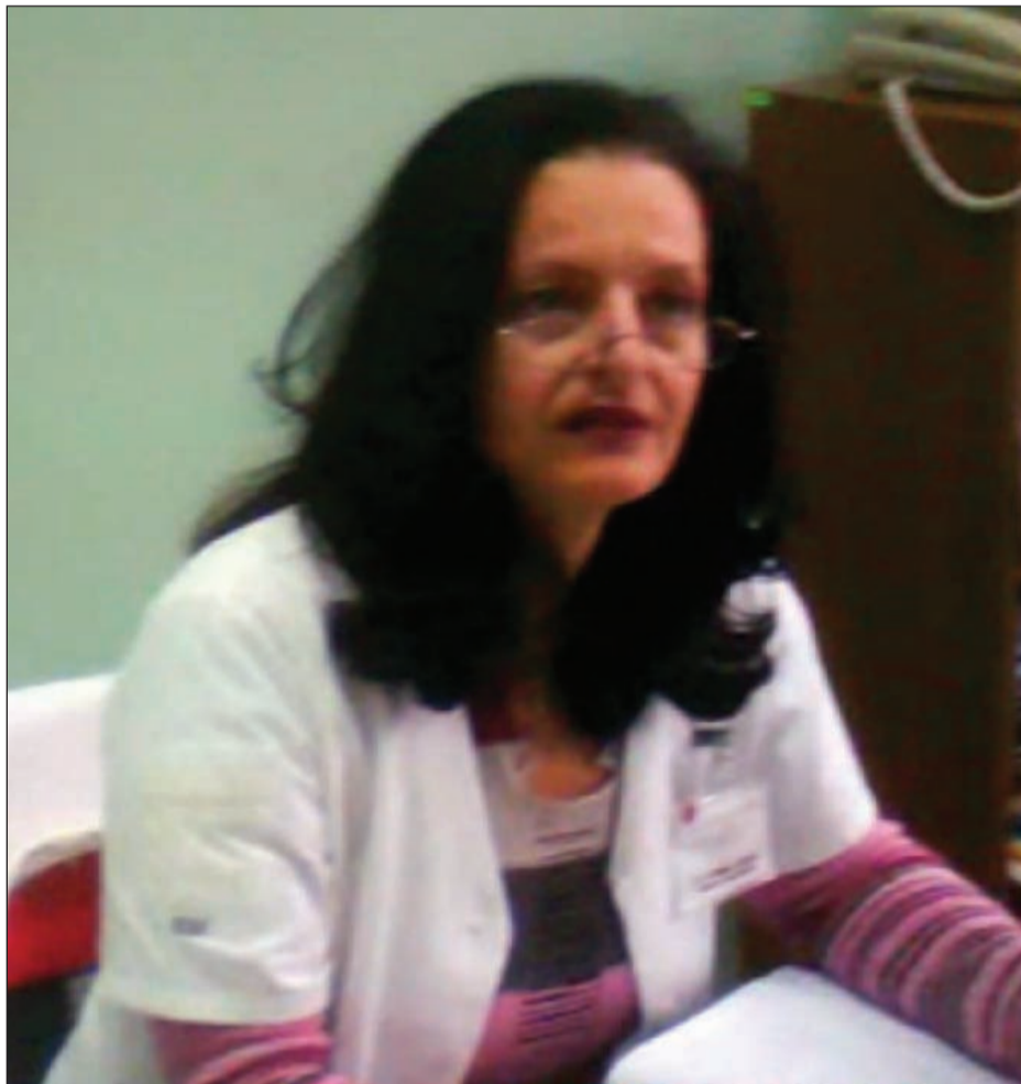
O doctoriță din Braşov a primit şpagă 300 de lei pentru a favoriza un pacient

După ce au aflat numele pacientului, s-au îndreptat spre Centrul de hematologie din Braşov. Portarul i-a îndrumat spre camera asistentelor. I-au spus unei asistente că au nevoie de o unitate de sânge care nu se găseşte la Spitalul Judeţean, pentru un prieten care are nevoie de o interven- ție chirurgicală urgentă. Asis-