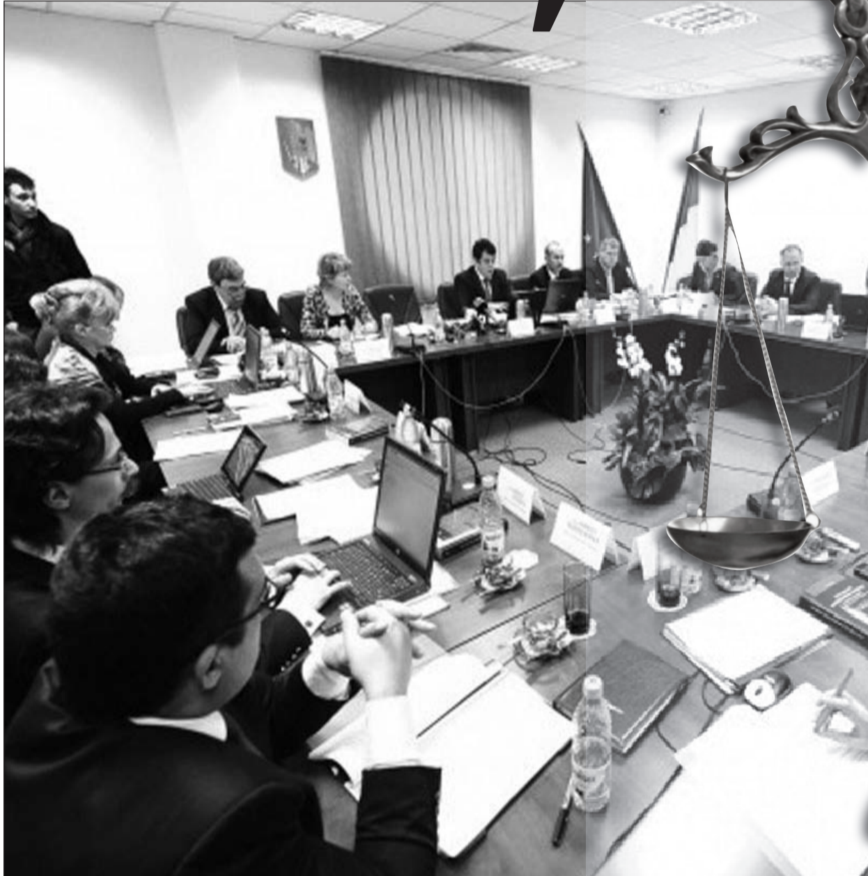
Controlul asupra CSM, miza războiului din Justiție

În spatele aparentei bătălii dintre procurori și judecători sunt interesele politicianilor care vor imunitate