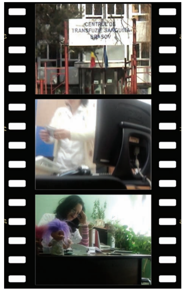
Reportajul a fost făcut cu camera ascunsă

Apoi li s-a explicat faptul că pentru rezolvarea problemei lor „pot aştepta şi două sau trei zile, deoarece sunt pacienţi care au venit şi cu 80 de donatori”.