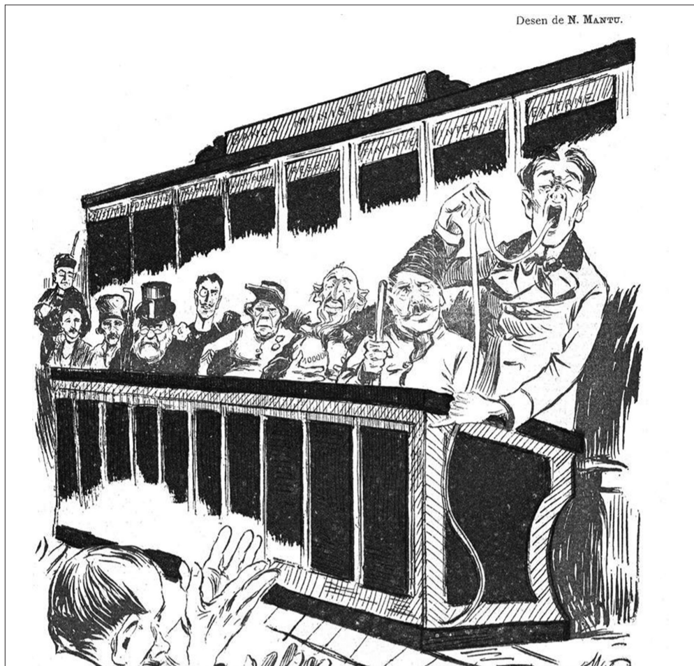
Săptămânalul Furnica, 1904, periodic semnat de G. Ranetti și N.D.Țăranu.

Este foarte interesant că, priviți dinspre administrație înspre micro-economie, mai toți antreprenorii suntem niște indezirabili care nu fac altceva decât evaziune fiscală, afectând, în urma participării la economia națională, însăși stabilitatea bugetului de stat blocând astfel desfășurarea marilor proiecte ale nației, de parcă nu suntem unica țară din lume care termină anul pe minus în kilometri de autostradă!