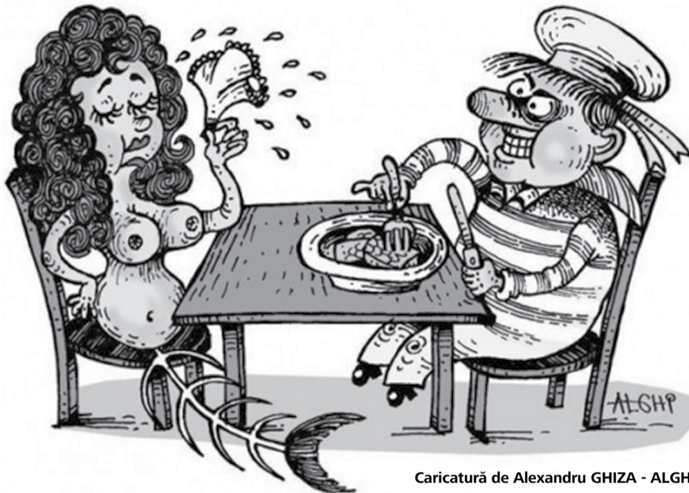
Caricatură de Alexandru GHIZA - ALGHI

Mergi la bancă? Perfect! N-am văzut pe nimeni urlând de fericire în fața băncii pentru că tocmai s-a băgat „sclav” la bancă și în următorii 30 de ani încerci să returnezi 360 de rate. Sau vreun client sărind într-un picior de fericire că are card de credit.