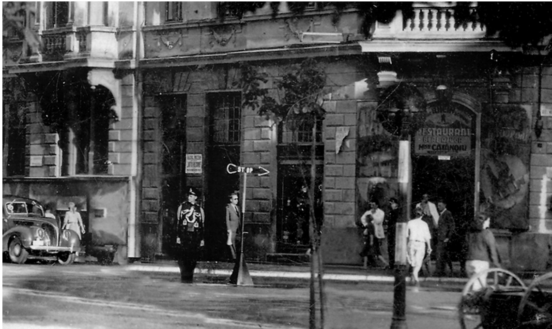
Polițist dirijând circulația la intersecția dintre actualele străzi Eroilor și Mureșenilor

„Regulamentului edil al orașului liber reg. Brașov” era foarte drastic. Erau admise ca materiale de construcție piatra, cărămida, varul, nisipul și betonul, fiind interzise cărămida crudă, lutul și mortarul de pământ sau de lut. În cazul în care pe trotuare se lăsau pe timpul nopții materiale de construcție, era obligatoriu ca acestea să fie luminate cu felinare. La desfacerea schelelor de protecție și la demolarea zidurilor, trecătorii și vecinii trebuia să fie „cât mai puțin molestați de praf, prin