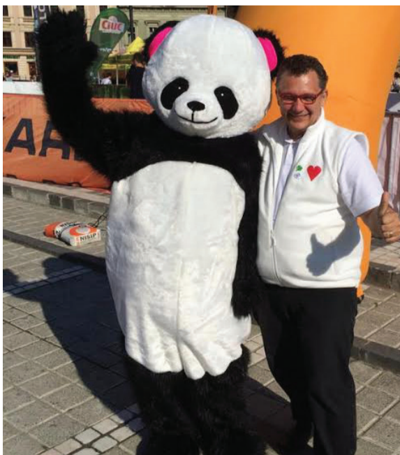
Ursuleții panda fără „șpilhozeni”