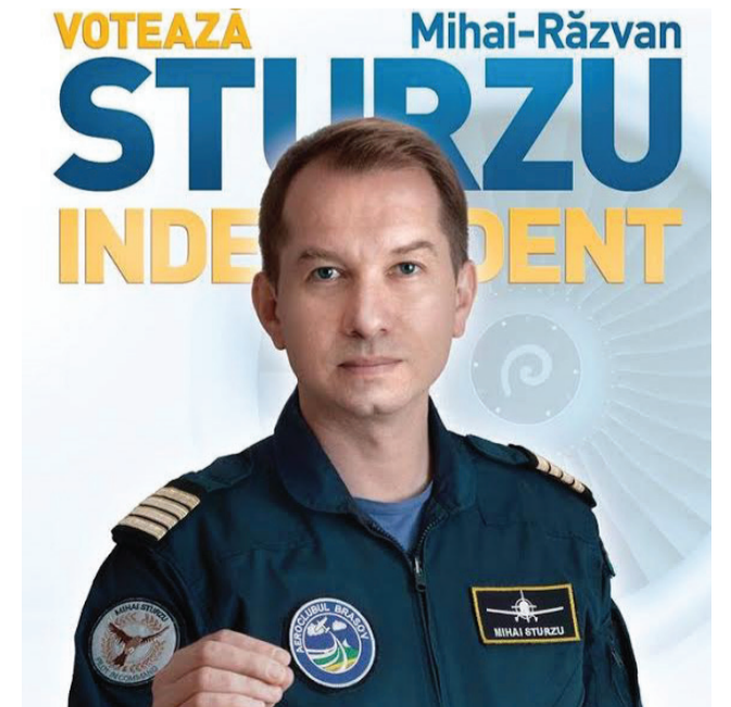
Plutonierul fără haine de oraș