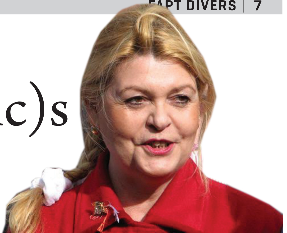
Reciclarea continuă. Să fim ecologiști până la capăt. Folosim și elasticul de prins banii înfășurat în danteluța de la marginea cearceafului ăla vechi