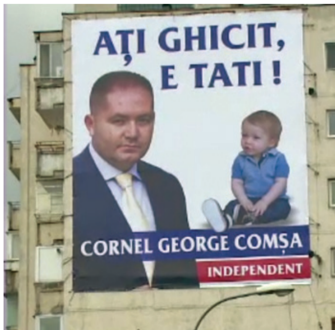
Costum clasic de familist ardelean