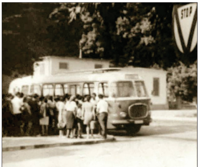
Plecarea spre Poiana Brașov, 1970.

În Strada Kogălniceanu, agitația nu încetează de dimineață de la 04:30 până noaptea la 01:00, acolo fiind amenajată autogara pentru "zona preorașenească" (diviziune administrativă ce includea 16 localități subordonate orașului Brașov, ca un fel de sector). De la stânga la dreapta, vedem întâi un pe atunci modern autobuz românesc interurban TV 2-R, pe linia 17 (Autogară - Str. Carpaților - Ștrandul Noua) - Noua fiind considerată suburbie rurală... Apoi, un autobuz sovietic ZiS-155 pe linia 23 (Autogară - Dârste - Dâmbul Morii) și un autobuz SR-101 carosat la Brașov, pe linia 47 (Brașov - Râșnov - Sohodol). Câțiva călători grăbesc pasul spre autobuzul care urma să plece pe linia 33 (Brașov - Vulcan), un "veteran" Škoda 706-R0 cehoslovac cu motor diesel. În plan mijlociu, distingem casele impozante din Str. M. Kogălniceanu nr. 3 și Str. Gh. Lazăr nr. 31, ce vor fi demolate în 1987, alături de multe altele de aceeași bună calitate. În plan îndepărtat, peste terasamentul fostei linii principale de cale ferată (desființată în 1962, azi B-dul Griviței), distingem silueta blocurilor din Str. 9 Mai.