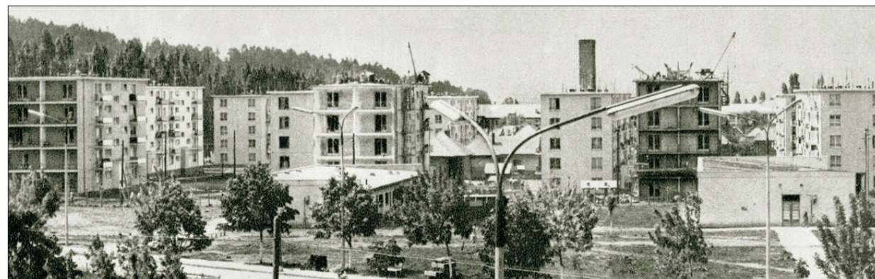
Strada Jupiter în construcție, văzută dintr-un "bloc vechi" de pe B-dul Steagul Roșu. Se văd și casele rămase din fosta Str. Csiki Iosif, parțial demolată, parțial înglobată în Str. Uranus. Foto 1961-62.

Pasagerii așteptau în mod civilizată îmbarcarea, la două cozi: cea principală, pentru locuri pe scaune (sau și în picioare), iar cea suplimentară, doar pentru locuri în picioare. Autobuzul oprea de două ori, în dreptul fiecărei cozi, iar controlorii ordonau închiderea ușii, după completarea capacității de încărcare autorizate pe acest traseu (70% din cea maximă a vehiculului).