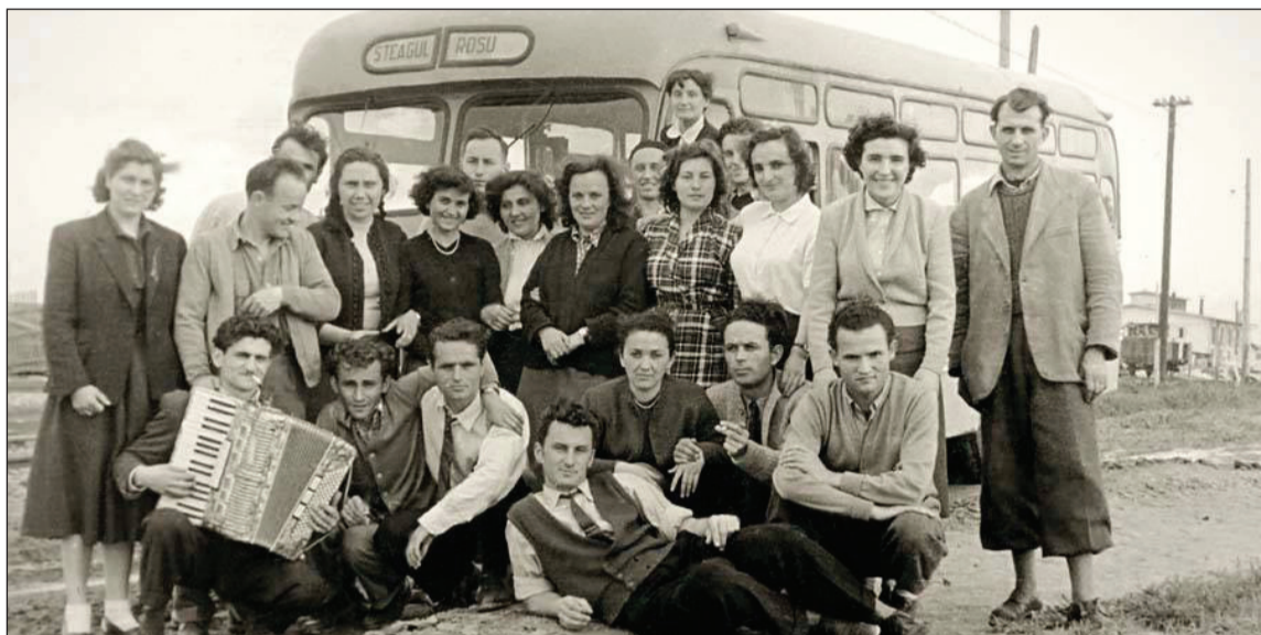
Muncitori ai Uzinelor "Steagul Roșu", undeva într-o excursie, la sfârșitul anilor '50.