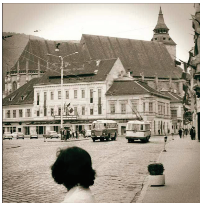
Privind înapoi spre trecut. August 1967